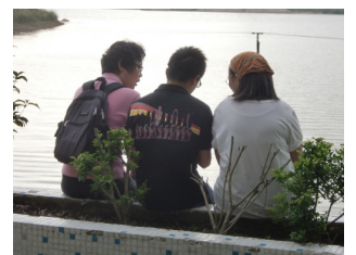
迦南農場：與學生談心

* 報名者請出席 22/9(週四) 營前祈禱會 (7:45-9:00PM 十三樓)